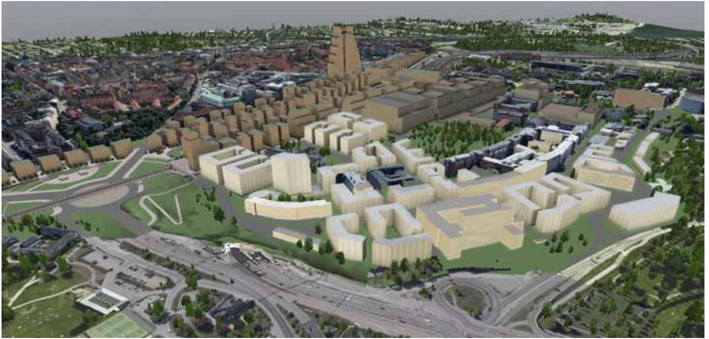
Illustration för sjukhusområdet och hela Hagastaden.