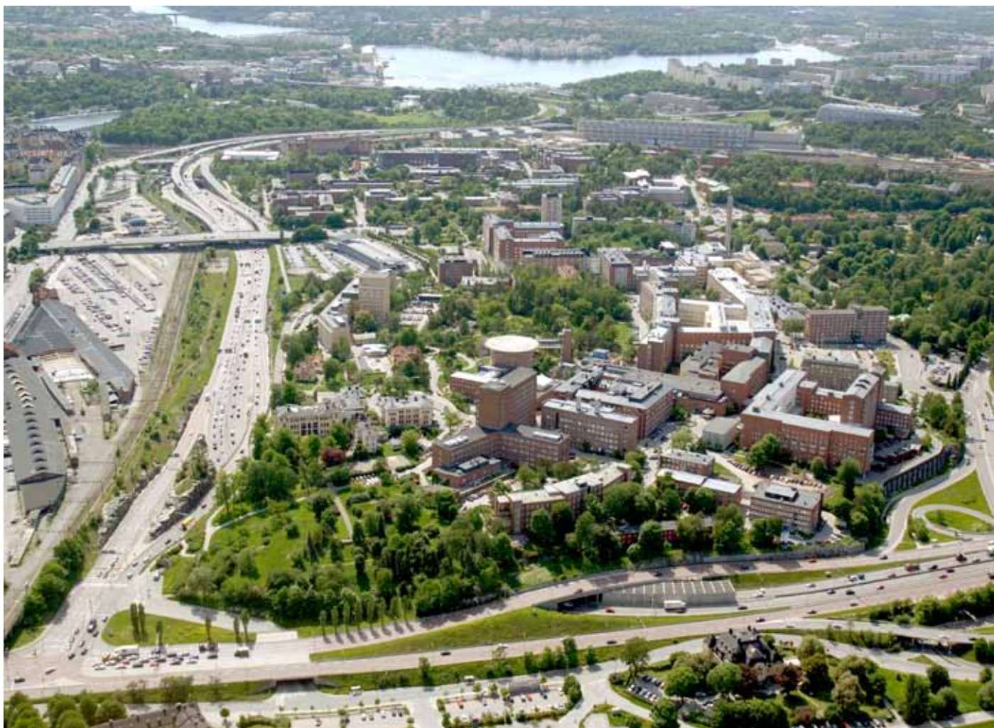
Flygbild från 2006 över Karolinska sjukhusområdet.

Hagastaden har unika förutsättningar för att bli landets bästa etableringsområde inom Life Science. Här har Stockholm Life sitt epicentrum varifrån Sverige ska växa internationellt inom livsvetenskaperna. Karolinska sjukhusområdet kommer fortsätta sin historiska resa för människors hälsa.