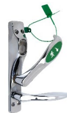
Beslag med separat utrymningshandtag. Använd i undantagsfall.