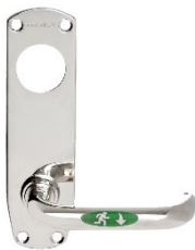
Beslag med split spindle-funktion (insida)

Beslag med separat utrymningshandtag ska undvikas på dörrar där många personer passerar eller där utrymningsbeslaget riskerar att användas ofta, då dessa slits ut efter en kort tid.