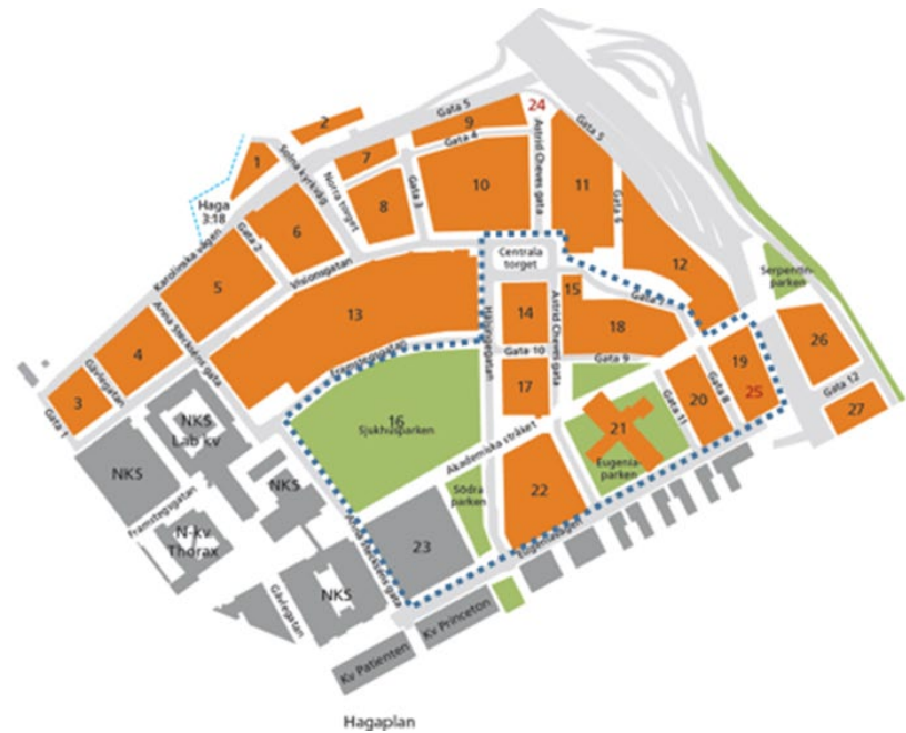
Detaljplaneområde detaljplan 1, enligt bilaga 1 "Principöverenskommelse avseende detaljplan 1, utveckling av delar av fastigheterna Haga 4:17 och Haga 4:18 i Norra Hagastaden i Solna"

Genom denna principöverenskommelse startar arbetet inom Norra Hagastaden med ett detaljplanearbete över ett stort område i de delar av det gamla sjukhusområdet som gränsar mot Stockholms stad och möter upp den utveckling som skett där. Med den här första detaljplanen exploateras området utifrån och in, från syd-sydost, liksom den angivna arbetshypotesen i FSN beslutet, istället för som tidigare landstingsfullmäktigebeslut med start i centrum med det tidigare huvudblocket, kvarter 13.