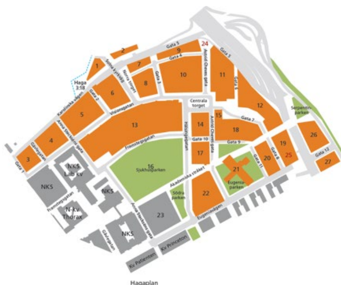
Kvartersstruktur och kvartersnummer inom planprogram Norra Hagastaden.

Uthyrningsarbetet skulle enligt beslutet utgå från arbetshypotesen att Norra Hagastaden ska avvecklas och utvecklas utifrån och in, från syd-sydöst, istället för som tidigare beslut, inifrån och ut med det gamla huvudblocket, kvarter 13, först. Beslutet innebar att uthyrningsarbetet nu är igång och att flertalet uthyrningar med tidsbegränsade avtal har tecknats.