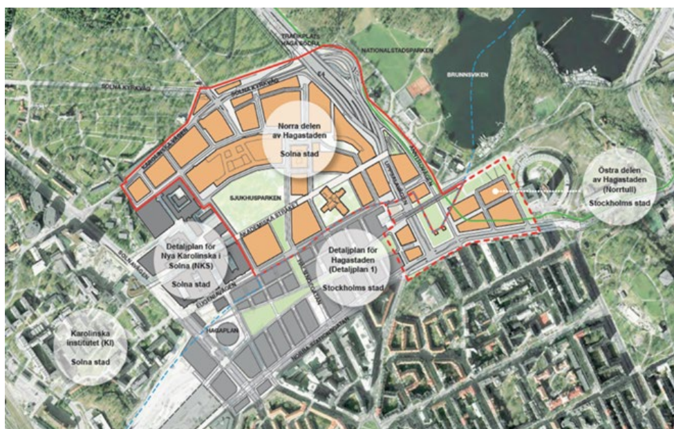
Hagastadens olika områden och detaljplaner, ur Planprogram Norra delen av Hagastaden, Solna Stad

Utvecklingen av Hagastaden som helhet går framåt och visionen från "Vision 2025" om en levande stadsdel med bostäder och verksamhetslokaler och ambitionen att skapa ett Life science kluster i världsklass lever i hög grad genom både privata och offentliga fastighetsägare och aktörer.